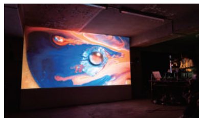
KASHIMA 2019 BEPPU ARTIST IN RESIDENCE 中山晃子パフォーマンス