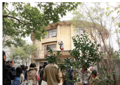
Hospitale Project / 野村誠ライブ・パフォーマンス